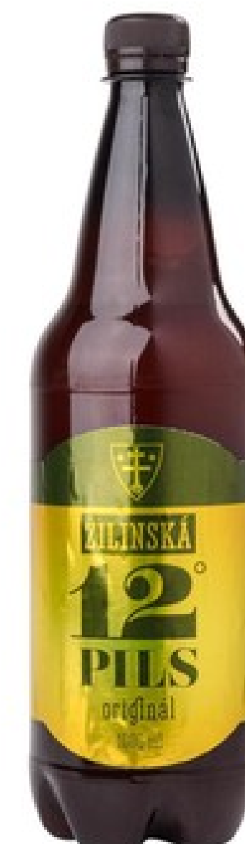
Žilinská 12° Pils