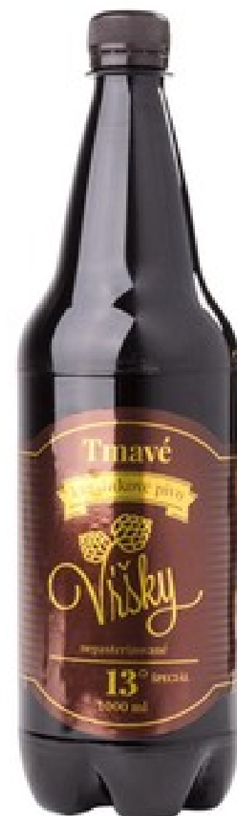
Tmavý špeciál 13°