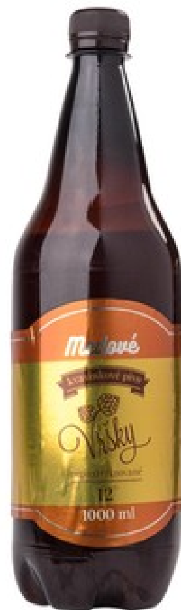
Medový špeciál 12°