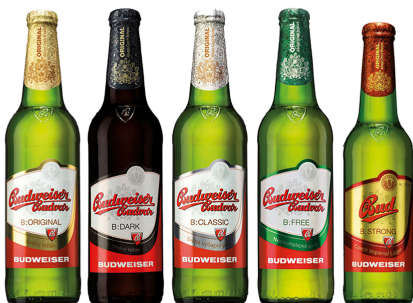
5 druhů piv