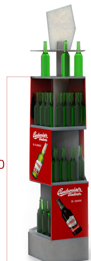
pohled z boku