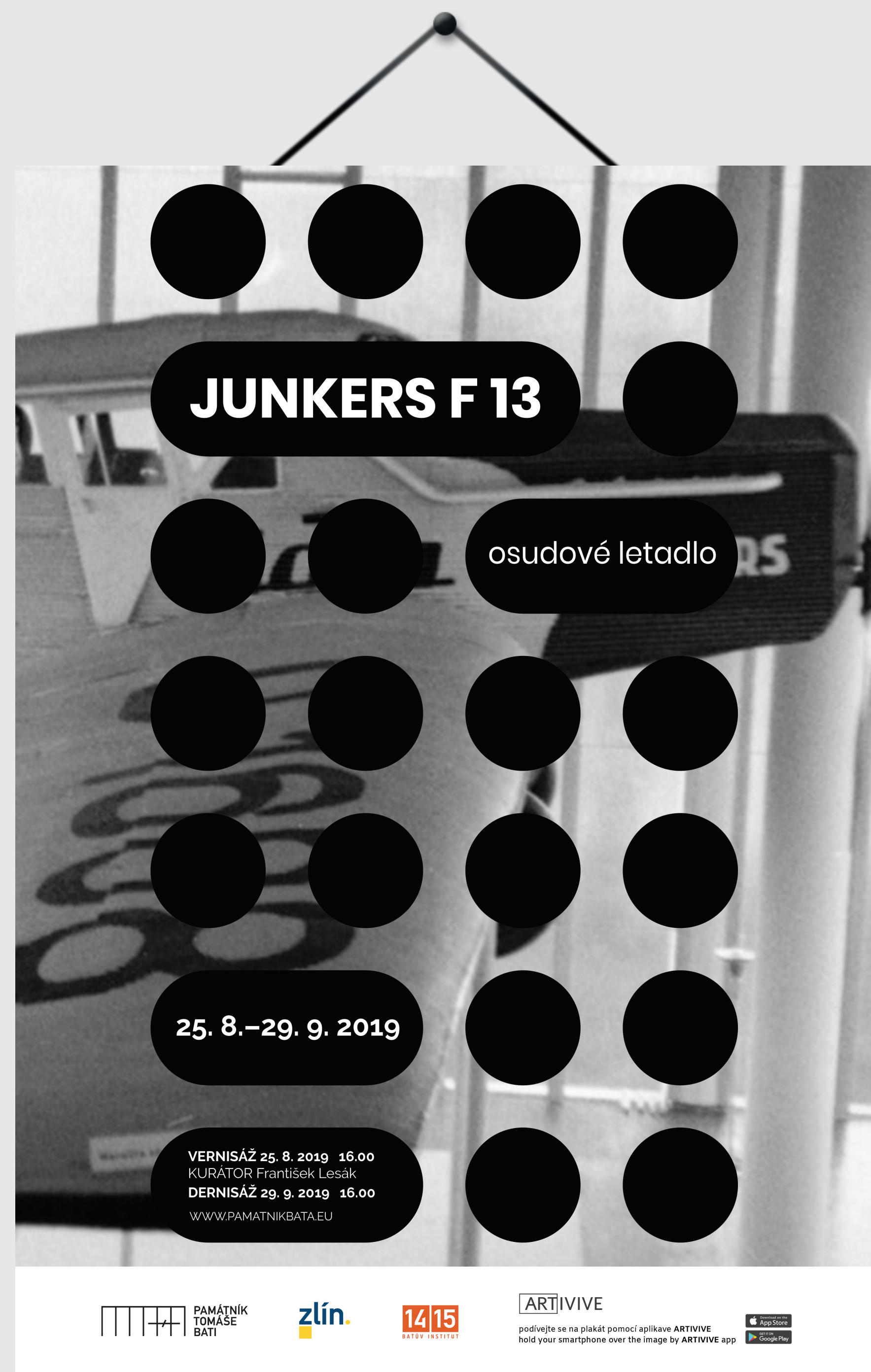
UKÁZKA PLAKÁTU NA VÝSTAVU

VIDEO | ANIMACE využití aplikace ARTIVIVE k užití rozšířené reality na plakáty, informační stojany a propagační tiskoviny