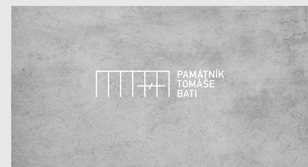
VIZITKA, přední strana