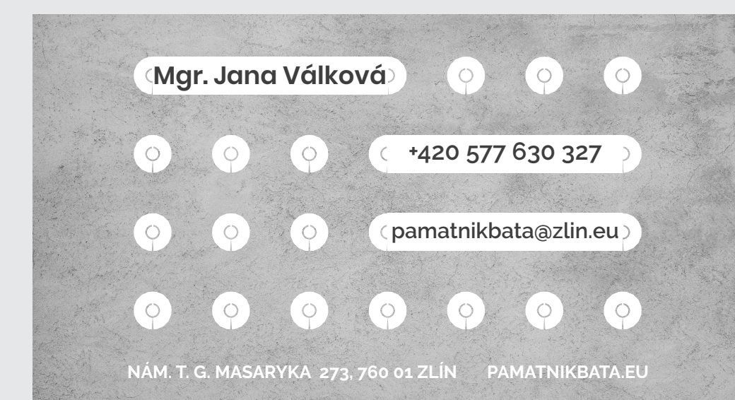
VIZITKA, zadní strana

pro tvorbu informačního stojanu jsou použity materiály vycházející z originálních prostředků, ze kterých je postavená samotná budova