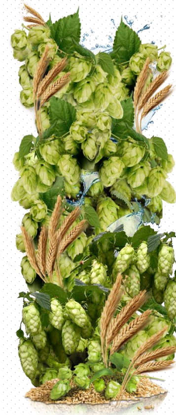
ZADNÁ NOSTNÁ STENA