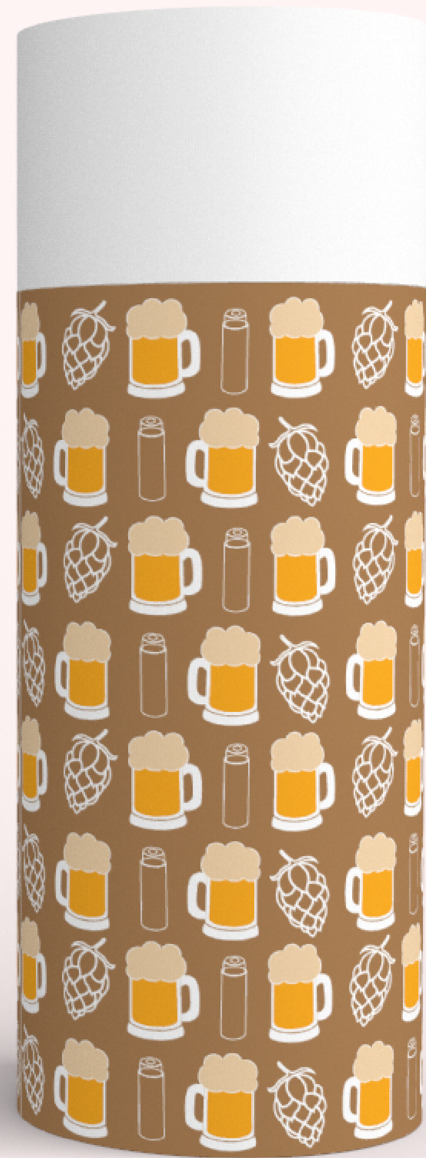
Nikola Valová, 1. ročník, ADE