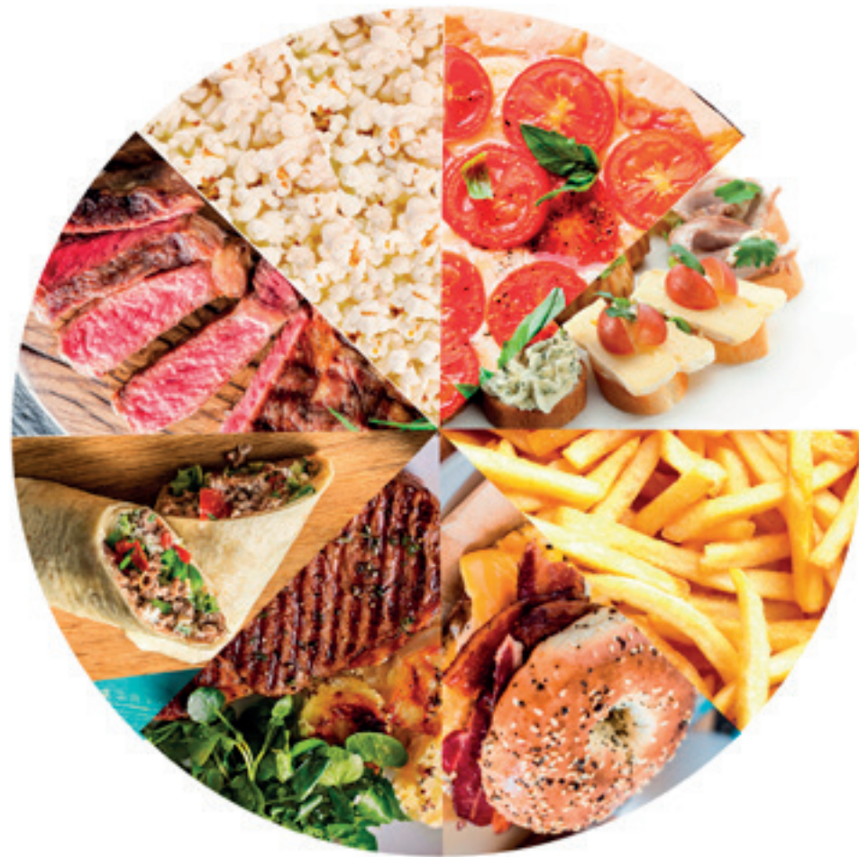
kruh č. 1 JÍDLO