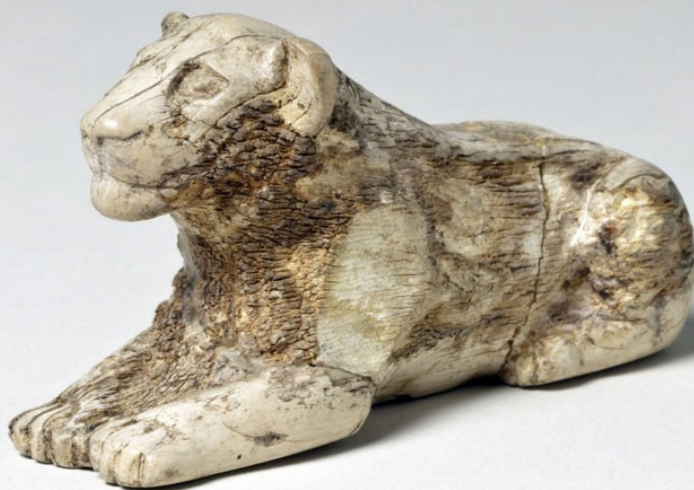
Senet a herná figúrka leva z obdobia Starovekého Egypta