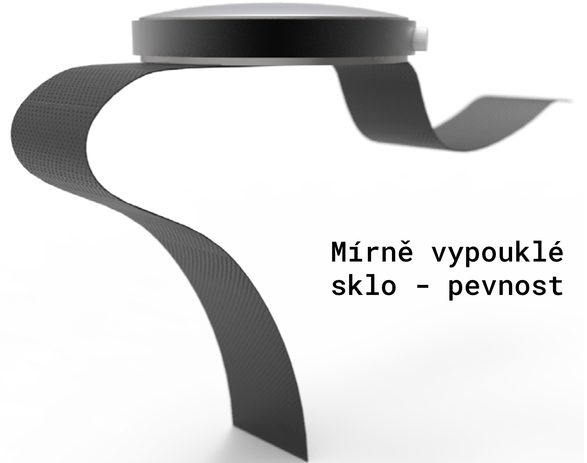
Mírně vypouklé sklo - pevnost