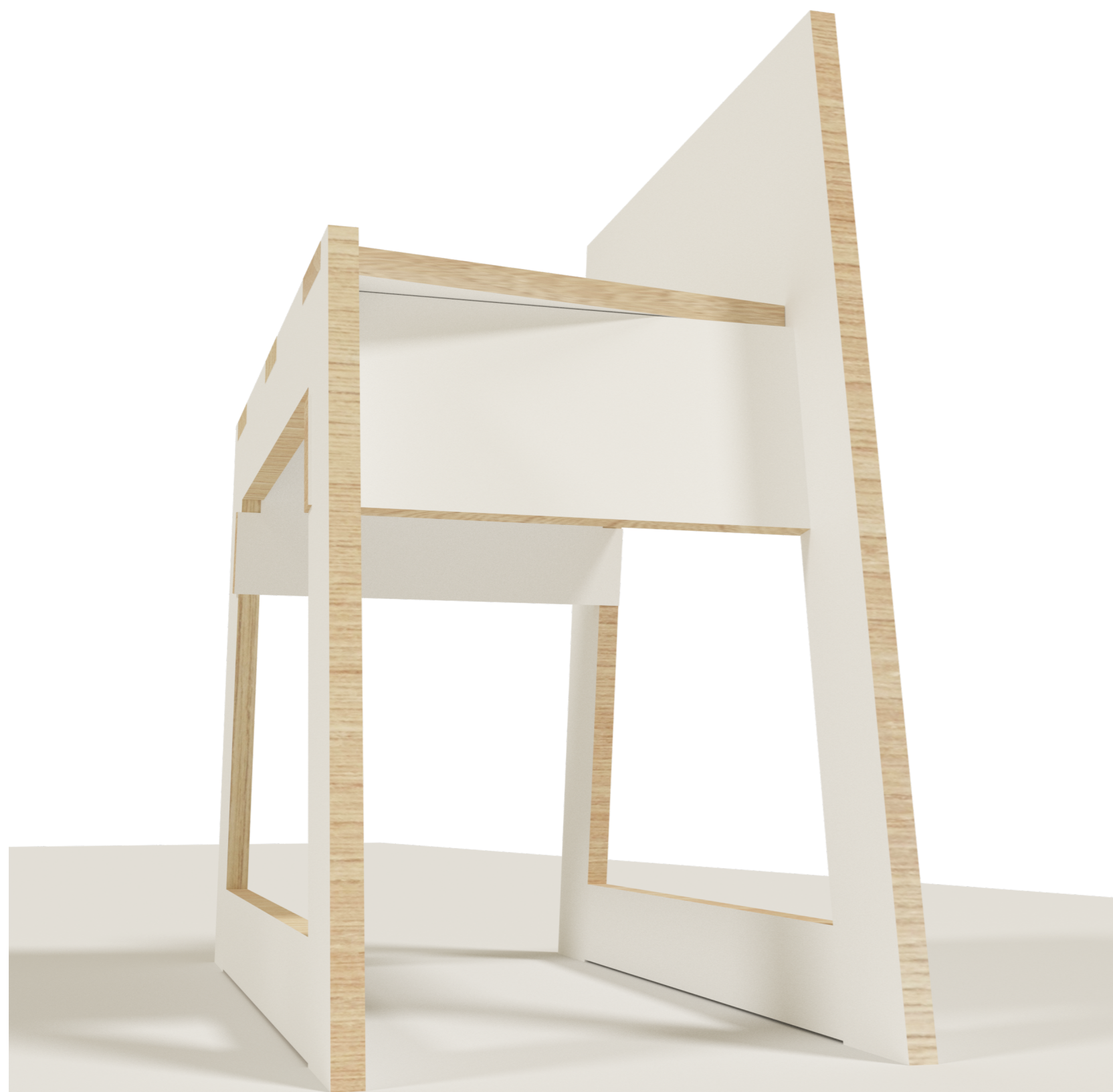
NÁVRH NÁBYTKOVÉHO SEZENÍ S VYUŽITÍM 1 M 2