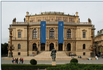
Aplikace značky na velkoformátové vlajky na budově Rudolfinu.