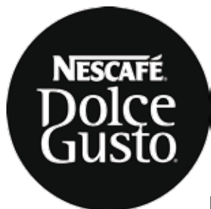
Profily pro umístění kapslí a zapuštění kávovaru Nescafé Dolce Gusto Genio