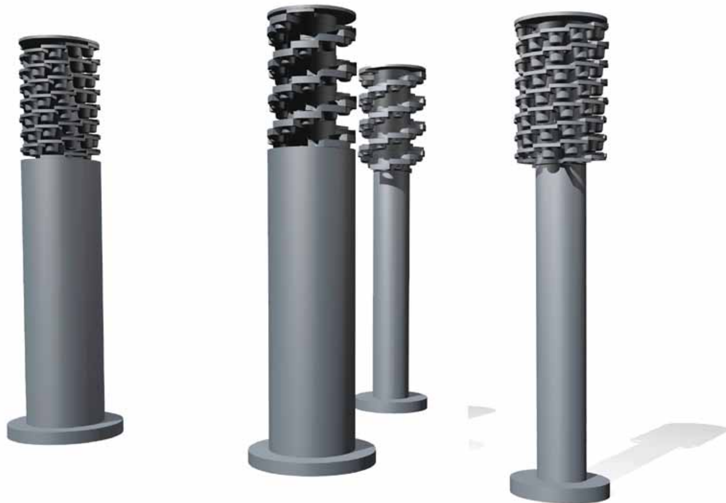
Návrh POP materiálu - Nescafe Dolce Gusto Genio