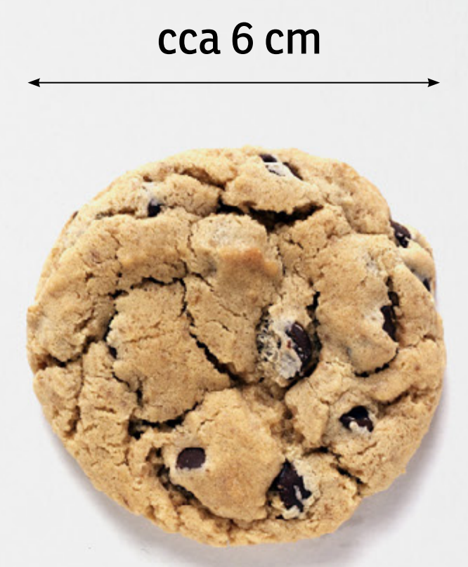
Hloubka – 1,4 cm