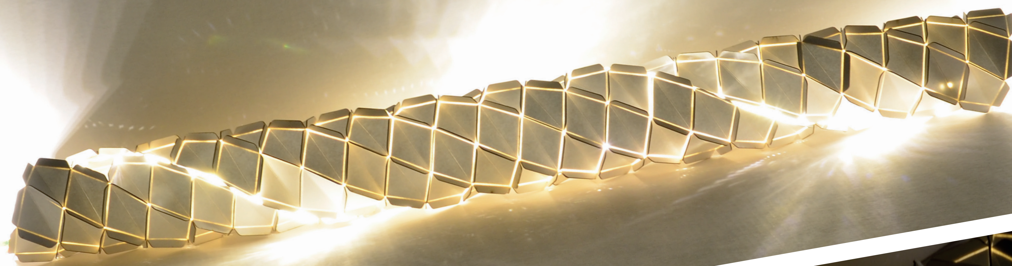
Variant 1 Možno umiestniť na podlahu, stôl. Zdroj: LED pásik 10 W