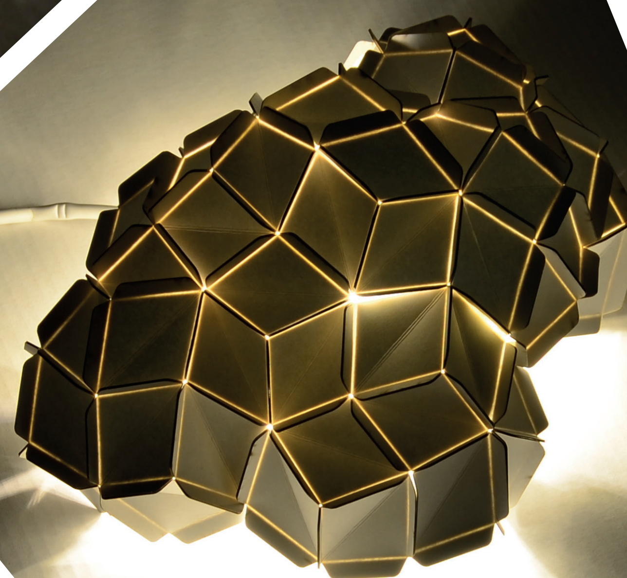
Variant 2 Možno umiestniť na podlahu, stôl. Môže tvoriť 3D panel na stenu. Zdroj: LED 2,4 W

Design svietidla tvorí sieť vytvorenou z polygónov. Štruktúru možno skladať do rôznych tvarov. Vnútro tvorí zrkadlová fólia ktorá odráža lúče do rôznych smerov.